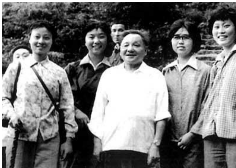
邓小平和恢复高考后的第一届大学生